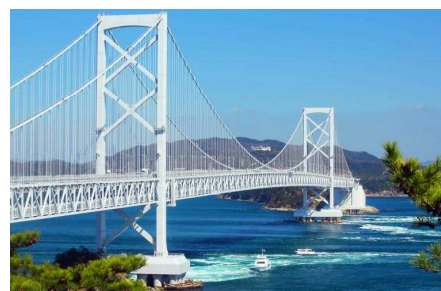
鳴門の渦潮・大鳴門橋